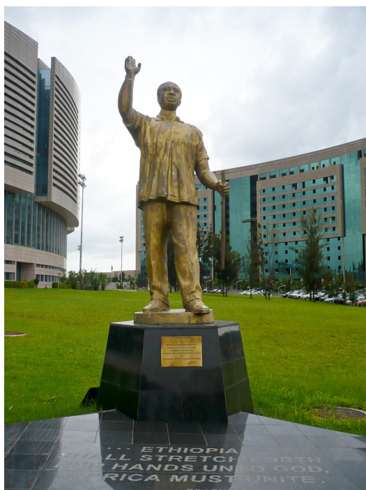
OBR. 2 Socha ghanského prezidenta Kwame Nkrumaha před budovou Komise AU v Addis Abebě.

Od roku 2007 byla přijata řada opatření na prohloubení spolupráce v oblasti míru a bezpečnosti mezi OSN a AU, jako např. podpora vytváření Africké mírové a bezpečnostní architektury (APSA), tedy orgánů AU, vzájemná setkávání členů RB OSN