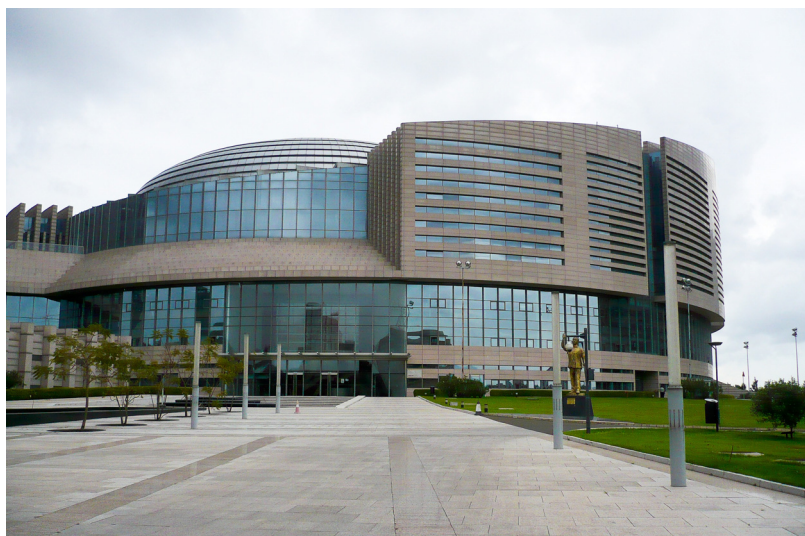
OBR. 1 Budova Komise AU v Addis Abebě, dar čínské vlády AU, dokončena 26. 12. 2011.